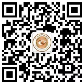
保山市中医医院订阅号