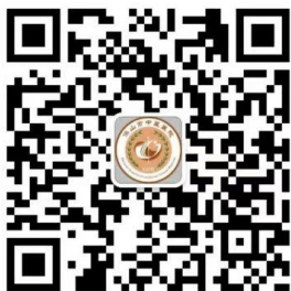
保山市中医医院互联网服务平台

请关注“保山市中医医院互联网医院”微信公众号，点击进入“互联网医院”点击“新冠肺炎防治网络门诊”找到要咨询的医生进行咨询便可。“互联网医院”可开展预约挂号、线上问诊、送药到家等服务。